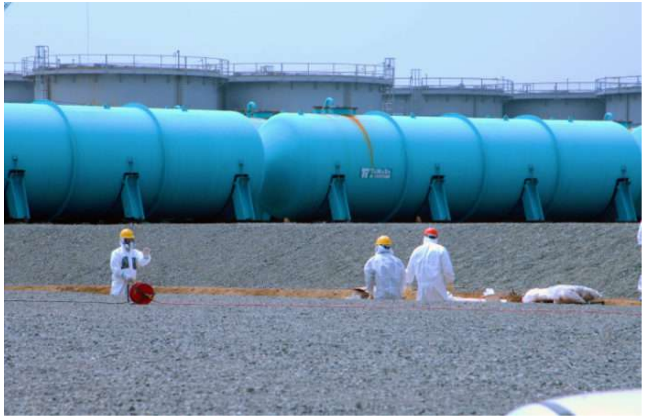
Depósitos para el tratamiento de agua radiactiva en Fukushima.

El embajador chino en Tokio hizo una declaración en la que afirma que el agua contaminada procedente de la central nuclear contiene más de 60 radionucleidos