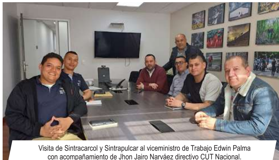
Visita de Sintracarcol y Sintrapulcar al viceministro de Trabajo Edwin Palma con acompañamiento de Jhon Jairo Narváez directivo CUT Nacional.

En esta ocasión, nuestros representantes se reunieron con el Viceministro de Trabajo, el señor, Edwin Palma Egea y algunos de sus asesores, así como también, con el señor presidente de la CUT nacional