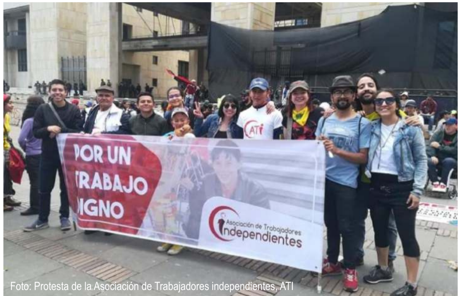
Foto: Protesta de la Asociación de Trabajadores independientes, ATI

Esto deja en evidencia que nuestra legislación laboral está desactualizada, no es aplicable a la realidad colombiana y deja sin derechos a la mayoría de trabajadoras y trabajadores, vulnerando así el derecho a la igualdad de todas las personas y la igualdad entre trabajadores.