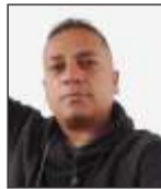
Por: Julián Cabanillas Secretario General Cut Bogotá Cundinamarca